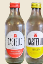
CASTELLO Original / Limão / Finna (250 ml) 1.99€