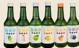
SOJU C/SABORES Pêssego / Maça / Uva / Iogurte / Morango / Mirtilo / Ameixa / Yuzu