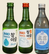
SOJU Fresh / Original / Jinro