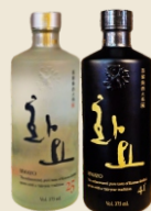
SOJU PREMIUM Original / Zero (375 ml)