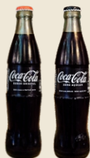
COCA-COLA Original / Zero (350 ml) 2.70€