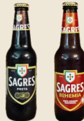
SAGRES Preta / Bohemia (330ml) 3.30€