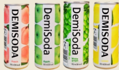
DEMISODA Limão / Pêssego / Maça / Uva (250 ml)