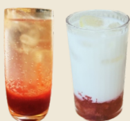
MORANGO ADE / MORANGO LATTE

Sumo caseiro de morango com água gaseificada / leite